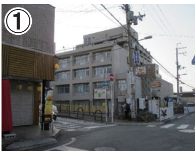
① 近鉄瓢箪山駅から商店街を南に向かい、四条図書館の手前を左折します。

近鉄奈良線瓢箪山駅下車、らくらくセンターハウスまで徒歩約30分です。らくらくセンターハウスまでは標高約140mまでの登り道です。がんばってください。