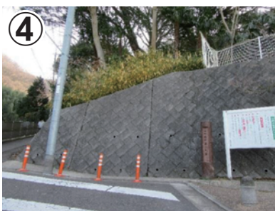
④ 右手に上四条第二公園が見えてきます。そのまま細い道へ直進して下さい。右手に階段がありますので、階段を登り左手へ進みます。