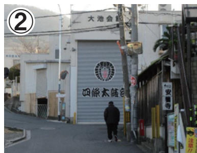
② 図書館で左折後、そのまま山に向かって進むと四條太鼓台の小屋が見えてきます。右側の道を進みます。