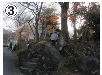
③ 道なりに進み、小さな川を越えます。左手へ山へ向かって進み、旧春日神社本殿跡の左側にある川沿いの道を真直ぐ進みます。