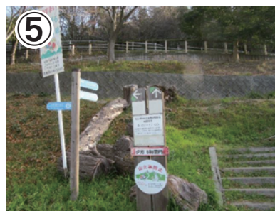
⑤ 木製のゲートをくぐるとなるかわ園地の駐車場です。左手に階段がありますので、登って左へ進んで頂くとセンターハウスが見えてきます。