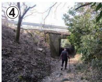
④急な階段を下りて、信貴生駒スカイラインの下かトンネルになっているのでくぐります。