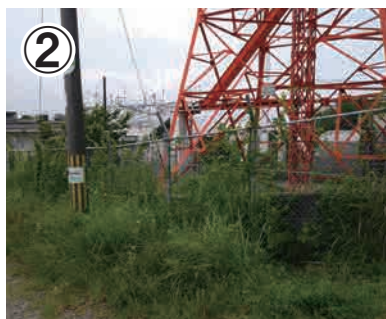
②遊園地の外周を進みます。右に電波塔を見ながら進むと、山道になります。