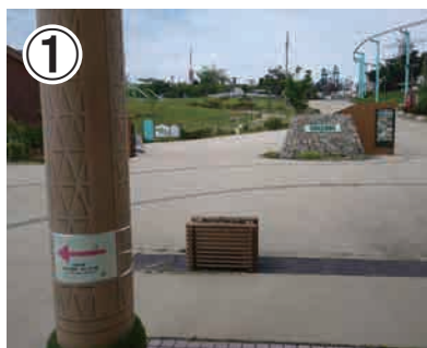
①近鉄生駒ケーブルの改札口を背に向け、遊園地左の道に沿って進み、電波塔を目指します。

近鉄生駒ケーブル生駒山上駅からあじさい園までは徒歩約40分です。山道のハイキングコースを楽しみながらたどり着けます。トレッキングシューズなど、足元が滑らない靴でお越しください。お車で直接あじさい園へはお越しいただけません。信貴生駒スカイライン(有料)を利用し、生駒山上遊園地駐車場(木曜日は定休・詳細は生駒山上遊園地のHPをご覧ください)から徒歩でお越しください。