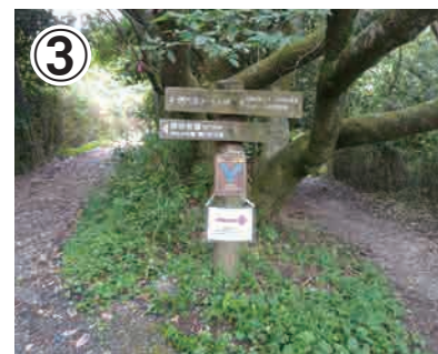
③暗峠近道が左側、府民の森あじさい園約500m 右側の案内がでできます。案内に従い右へ進みます。