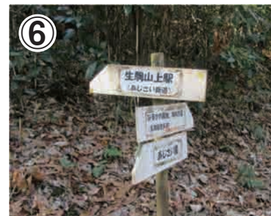
⑥また、分岐のところにあじさい園への案内がでできます。案内に沿って左へ進むと行くと管理道に出ますので、そのまま左に進んで下さい。