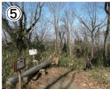
⑤あじさい新道を下ります。少し急な細い道を下りながら進みます。案内に沿ってあじさい園へお進みください。