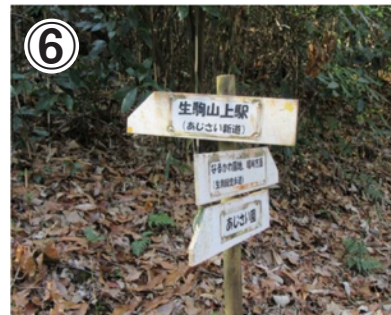
⑥また、分岐のところにあじさい園への案内がでできます。案内に沿って左へ進むと行くと管理道に出ますので、そのまま左に進んで下さい。