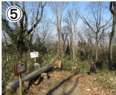
⑤あじさい新道を下ります。少し急な細い道を下りながら進みます。案内に沿ってあじさい園へお進みください。