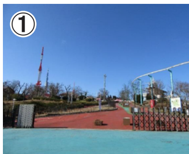
①近鉄生駒ケーブルの改札口を背に向け、遊園地内左寄りの道に沿って進み、電波塔を目指します。

近鉄生駒ケーブル生駒山上駅からあじさい園までは徒歩約40分です。山道のハイキングコースを楽しみながらたどり着けます。トレッキングシューズなど、足元が滑らない靴でお越しください。お車で直接あじさい園へはお越しいただけません。信貴生駒スカイライン(有料)を利用し、生駒山上遊園地駐車場(木曜日は定休・詳細は生駒山上遊園地のHPをご覧ください)から徒歩でお越しください。