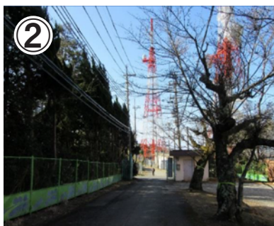
②左右に電波塔を見ながら進むと、遊園地を抜けます。進んでいくと山道になります。