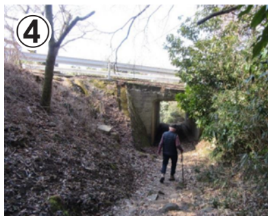
④急な階段を下りて、信貴生駒スカイラインの下かトンネルになっているのでくぐります。