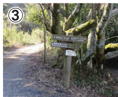
③暗峠近道が左側、府民の森あじさい園約500m 右側の案内がでできます。案内に従い右へ進みます。